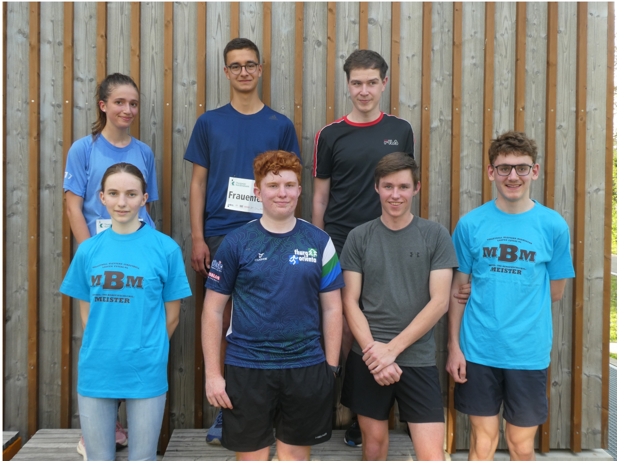
Die Teilnehmerinnen und Teilnehmer der MBM OL 2022